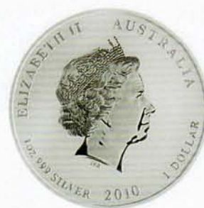
1 Dollar, Lunar-Serie II, Tiger 2010 (1 Unze)