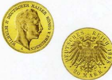
20 Goldmark, Wilhelm II. (geprägt von 1888 bis 1913)