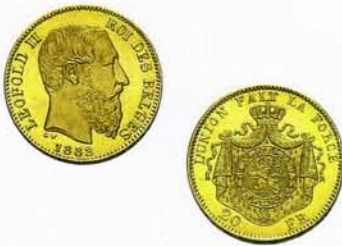
20 Franken, Leopold II.