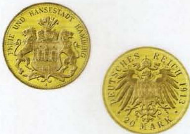
20 Goldmark, Hansestadt Hamburg (geprägt von 1875 bis 1900/1913)