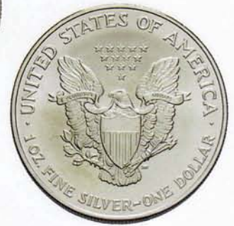
1 Dollar, Eagle (1 Unze)