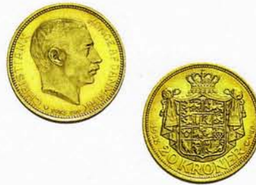
20 Kronen, Christian X.