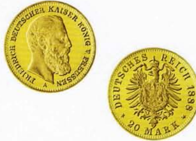
20 Goldmark, Friedrich III. (geprägt 1888)