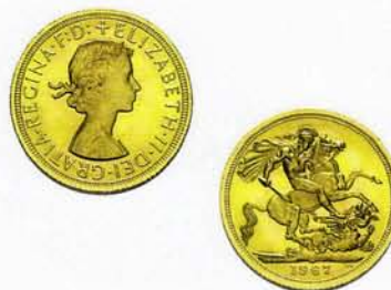
1 Pfund neu, Elisabeth II.