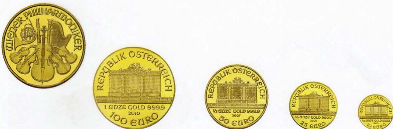
100 Euro, Philharmoniker (1 Unze)