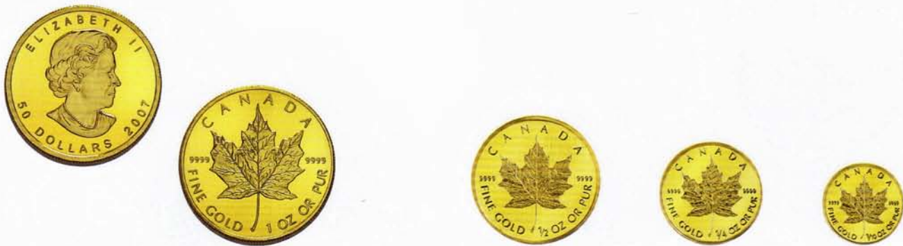
50 Dollar, Maple Leaf (1 Unze)