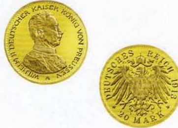
20 Goldmark, Wilhelm II., Uniform (geprägt von 1913 bis 1914)