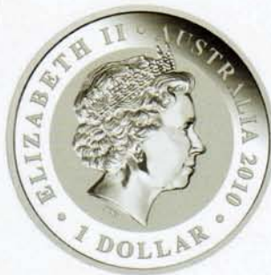
1 Dollar, Koala (1 Unze)