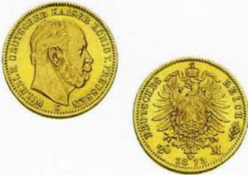
20 Goldmark, Wilhelm I. (geprägt von 1871 bis 1888)