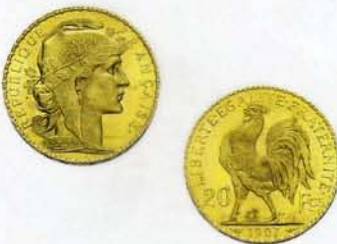
20 Franken, Marianne