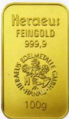
100 g (ohne Abbildung: auch als 1.000 g Barren erhältlich)