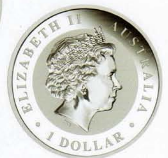
1 Dollar, Kookaburra (1 Unze)