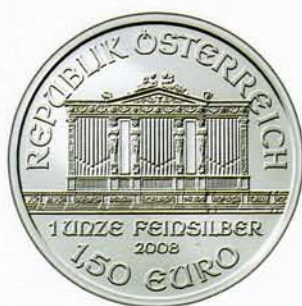
1,50 Euro, Philharmoniker (1 Unze)