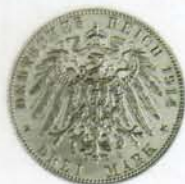
3 Mark, Hamburg (geprägt von 1908 bis 1914)