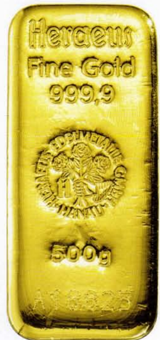
500 g (Abbildung nicht in Originalgröße)