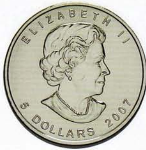
5 Dollar, Maple Leaf (1 Unze)